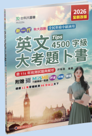
PD322 英文大考題卜書 (Tips)