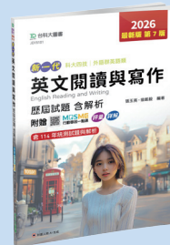
JD151 英文閱讀與寫作 歷屆試題