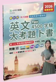
PD322 英文大考題卜書 (Tips)