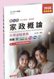
MD101 家政概論升學金鑰寶典