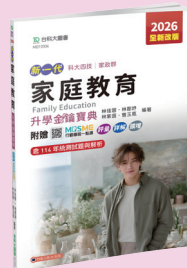
MD103 家庭教育升學金鑰寶典