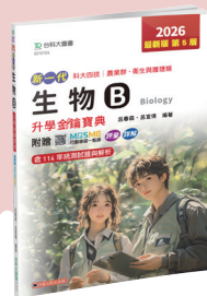
ID101 生物 B 升學金鑰寶典