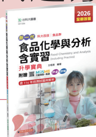
ID113 食品化學與分析含實習升學寶典