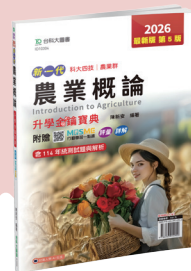
ID103 農業概論升學金鑰寶典