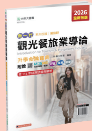
HD101 觀光餐旅業導論升學金鑰寶典