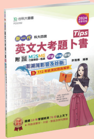
PD322 英文大考題卜書 (Tips)