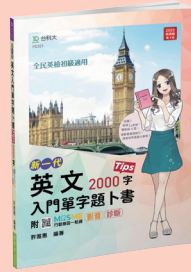
PD321 英文入門單字題卜書 (Tips)