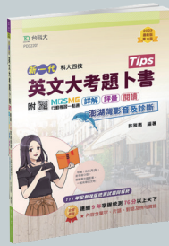
PD322 英文大考題卜書 (Tips)