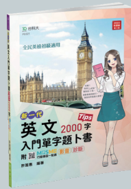
PD321 英文入門單字題卜書 (Tips)