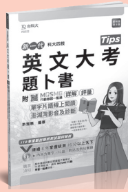
PD322 英文大考題卜書 (Tips)