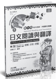
JD153 日文閱讀與翻譯 Power Note

作者將考題分為三類，第一類為「字彙型考題」經分析後約有 8 題；第二類「文章閱讀型考題」為 15 題，第三類「文法測驗型考題」為 27 題。本書的宗旨為文法歸納與總整理，所以綜觀考題，在面對新課綱第一次統測的狀況下，詳讀本書內容對於應付統測的「文法測驗型」考題命中率約為 93%。