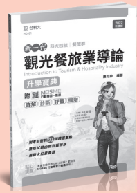
HD101 觀光餐旅業導論升學寶典