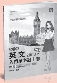
PD321 英文入門單字題卜書 (Tips)