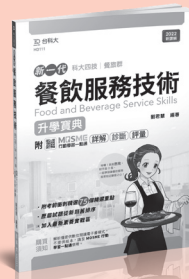
HD111 餐飲服務技術升學寶典