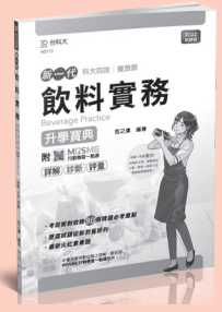
HD113 飲料實務升學寶典