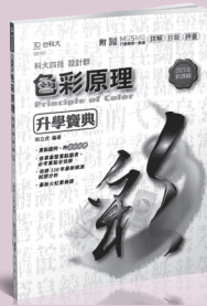
GD101 色彩原理升學寶典