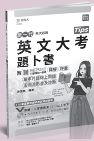
PD322 英文大考題卜書 (Tips)