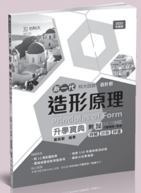
GD103 造形原理升學寶典