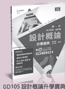
GD105 設計概論升學寶典