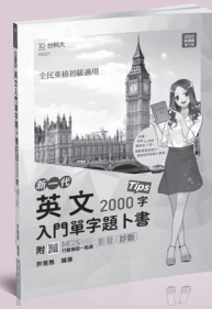
PD321 英文入門單字題卜書 (Tips)