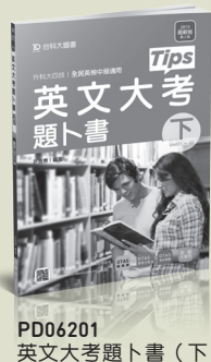
PD06201 英文大考題卜書 (下)