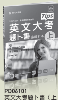
PD06101 英文大考題卜書 (上)