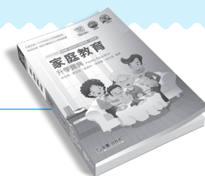
MD002 家庭教育升學寶典