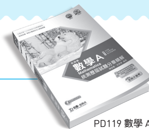
PD119 數學 A 統測歷屆試題分章精解