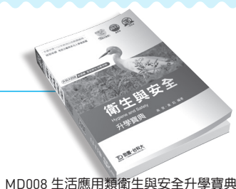
MD008 生活應用類衛生與安全升學寶典