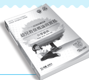
MD006 幼保類幼兒教保概論與實務升學寶典