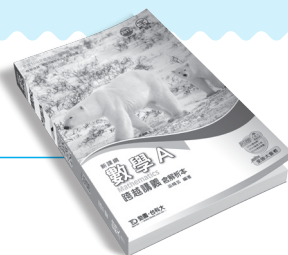
PD111 數學 A 跨越講義