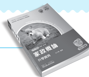
MD001 家政概論升學寶典