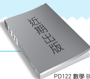
PD122 數學 B 領先講義