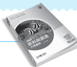
HD005 飲料與調酒升學寶典