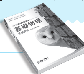
PD152 基礎物理升學寶典