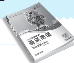
PD151 基礎物理跨越講義