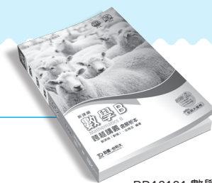
PD12101 數學 B 跨越講義