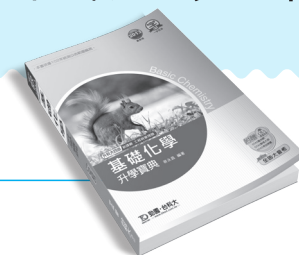
PD153 基礎化學升學寶典