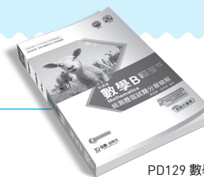
PD129 數學 B 統測歷屆試題分章精解