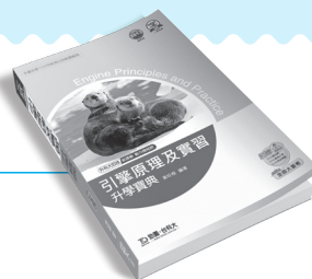
CD00201 引擎原理及實習升學實典