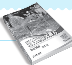
CD003 電工概論與實習跨越講義