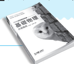
PD152 基礎物理升學寶典