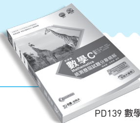
PD139 數學 C 統測歷屆試題分章精解