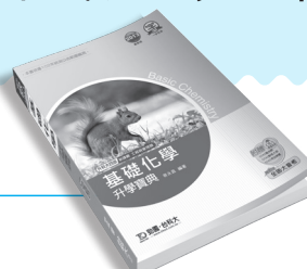
PD153 基礎化學升學寶典