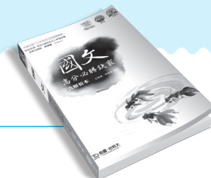
PD01702 國文高分必勝訣竅