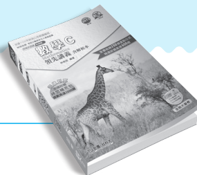
PD13201 數學 C 領先講義