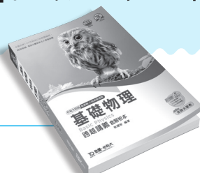
PD151 基礎物理跨越講義