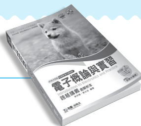
CD004 電子概論與實習跨越講義