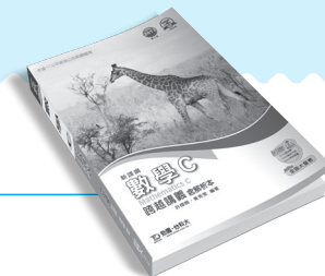
PD13101 數學 C 跨越講義