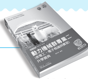
CD005 專業二 (電工概論與實習、電子概論與實習) 升學寶典