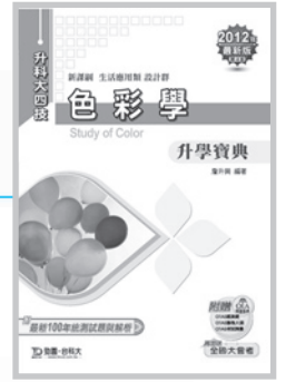
D85603 升科大四技色彩學 升學寶典