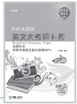
PD00602 升科大四技 英文大考題卜書