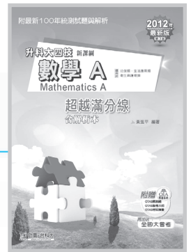
D61402 升科大四技 數學 A 超越滿分線