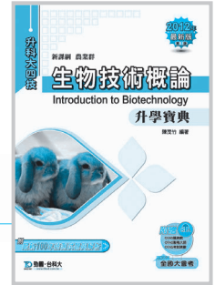
D91202 升科大四技生物技術 概論升學寶典