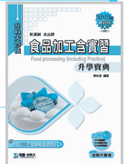
D90103 升科大四技食品加工 含實習升學寶典