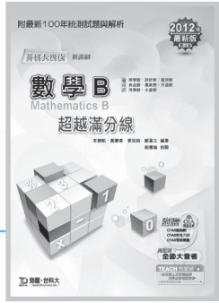
D62203 升科大四技數學 B 超越滿分線