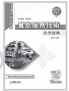
D87401 升科大四技餐旅群 餐旅服務技術升學寶典