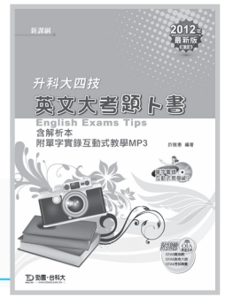
PD00602 升科大四技 英文大考題卜書