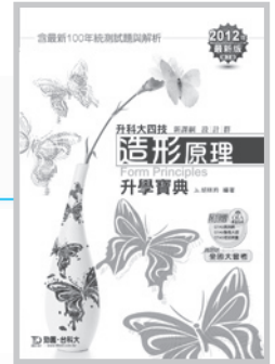
GD00201 升科大四技造形原理 升學寶典