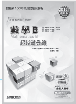
D62203 升科大四技數學 B 超越滿分線