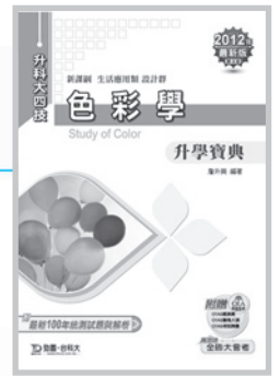
D85603 升科大四技色彩學 升學寶典