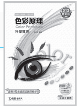
D83103 升科大四技色彩原理 升學寶典