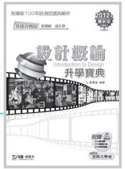
D84701 升科大四技設計群 設計概論升學寶典